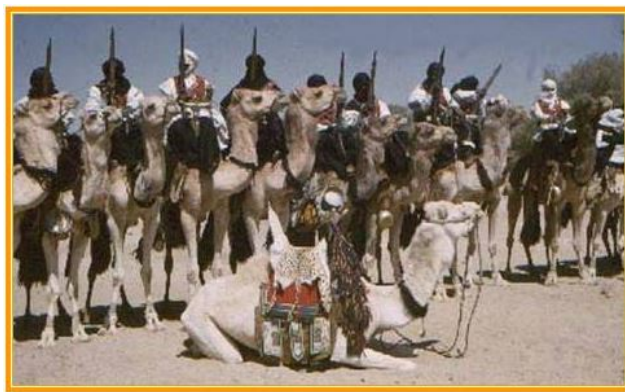
Peloton de méhari en attente du chef