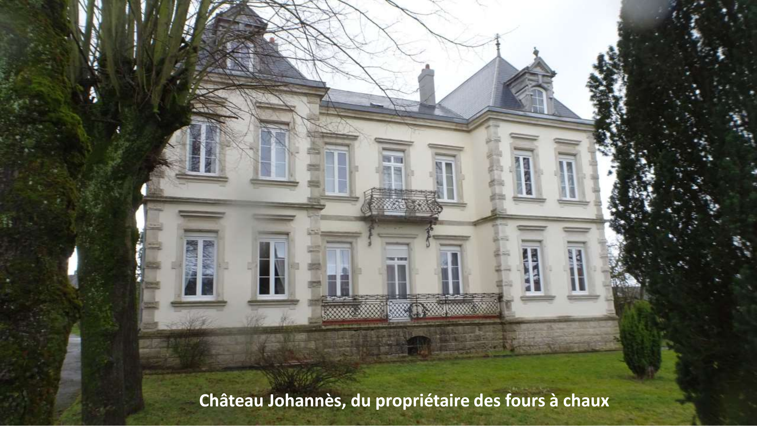
Château Johannès, du propriétaire des fours à chaux