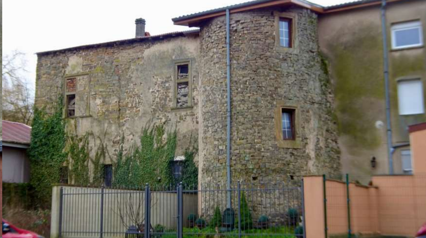
Avant et arrière du château