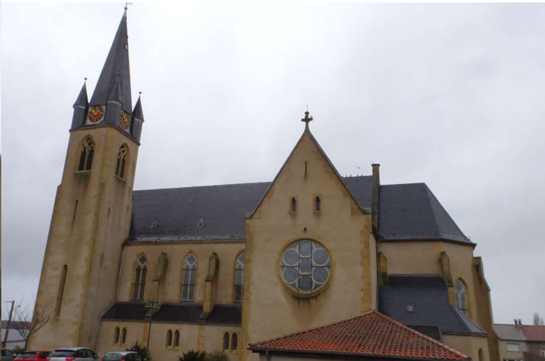
Eglise Saint Catherine