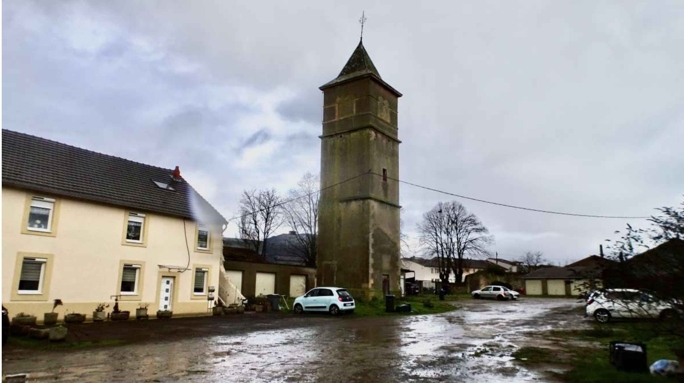
Dans la cour du château, il reste aussi le clocher de l'ancienne église