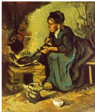
VAN GOGH paysanne faisant la cuisine au coin du feu (1885)