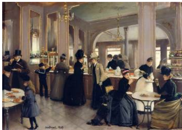
Jean Béraud La pâtisserie Gloppe (avenue des Champs-Élysées)