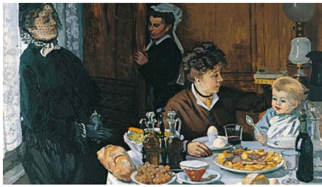
Claude MONET Le Déjeuner (1868-1869)