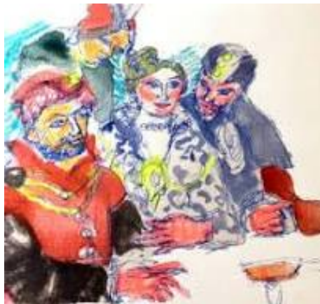
VERONESE Les noces de Cana '1562-1563)