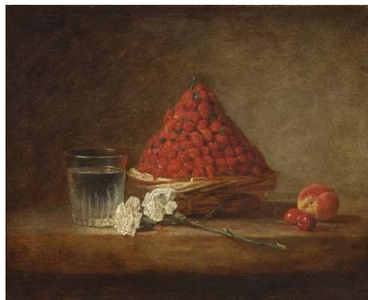
Jean Siméon Chardin Le panier de fraises des bois (1761)