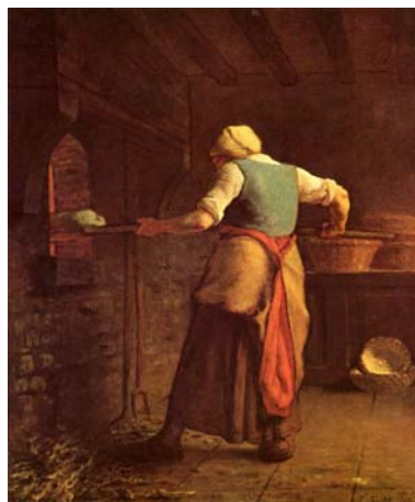
J F MILLET Pain de pâtisserie (1854)