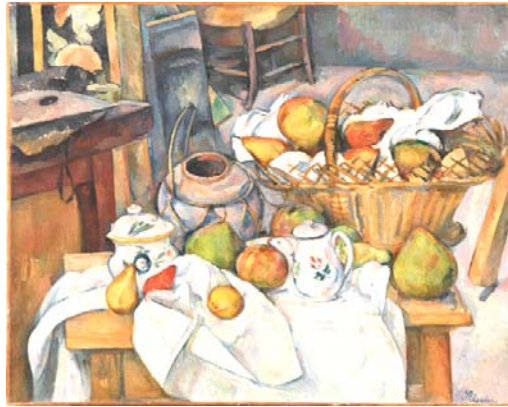
Paul CEZANNE La table de cuisine (1888-1890)