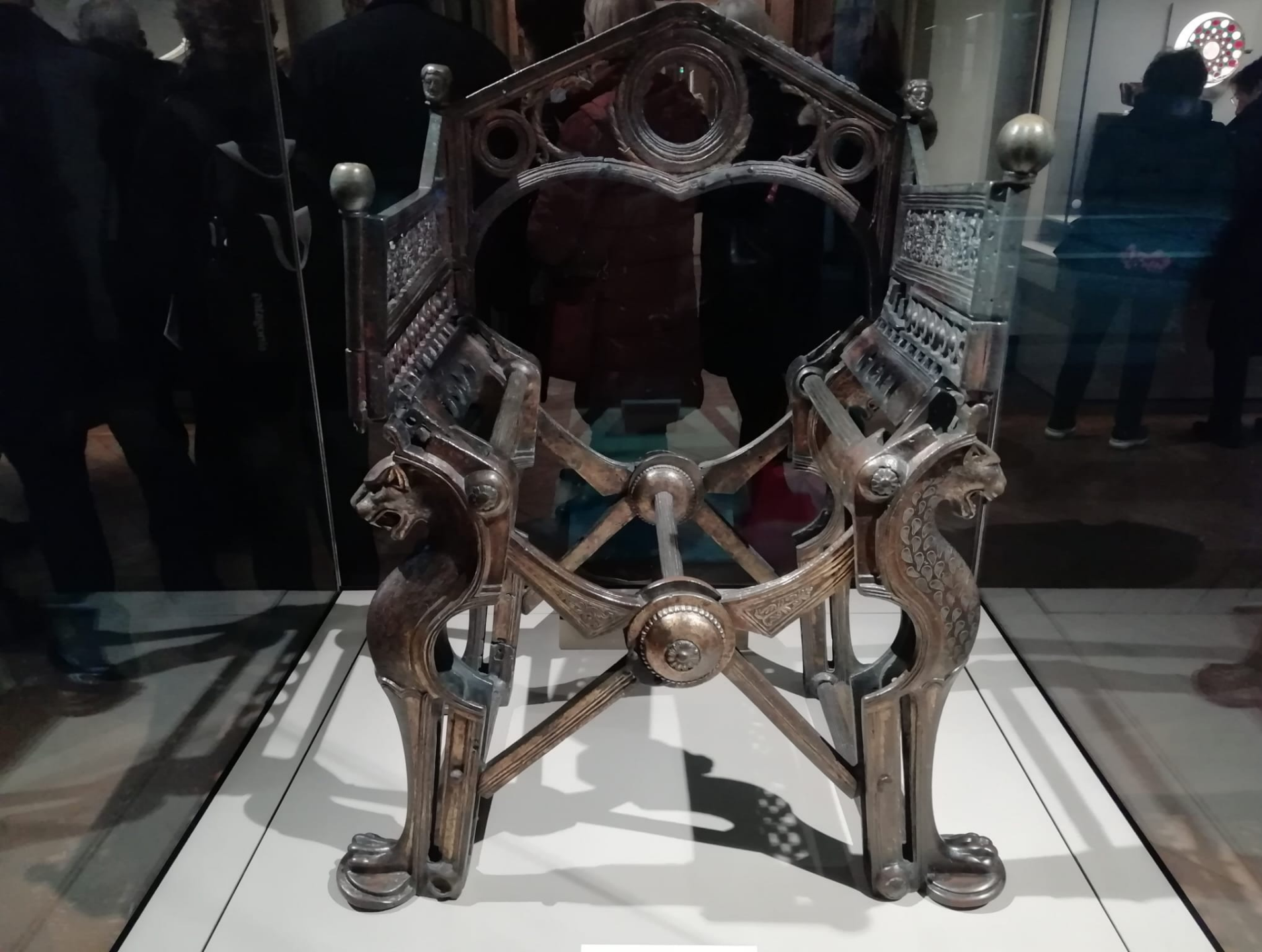
Trône du roi DAGOBERT