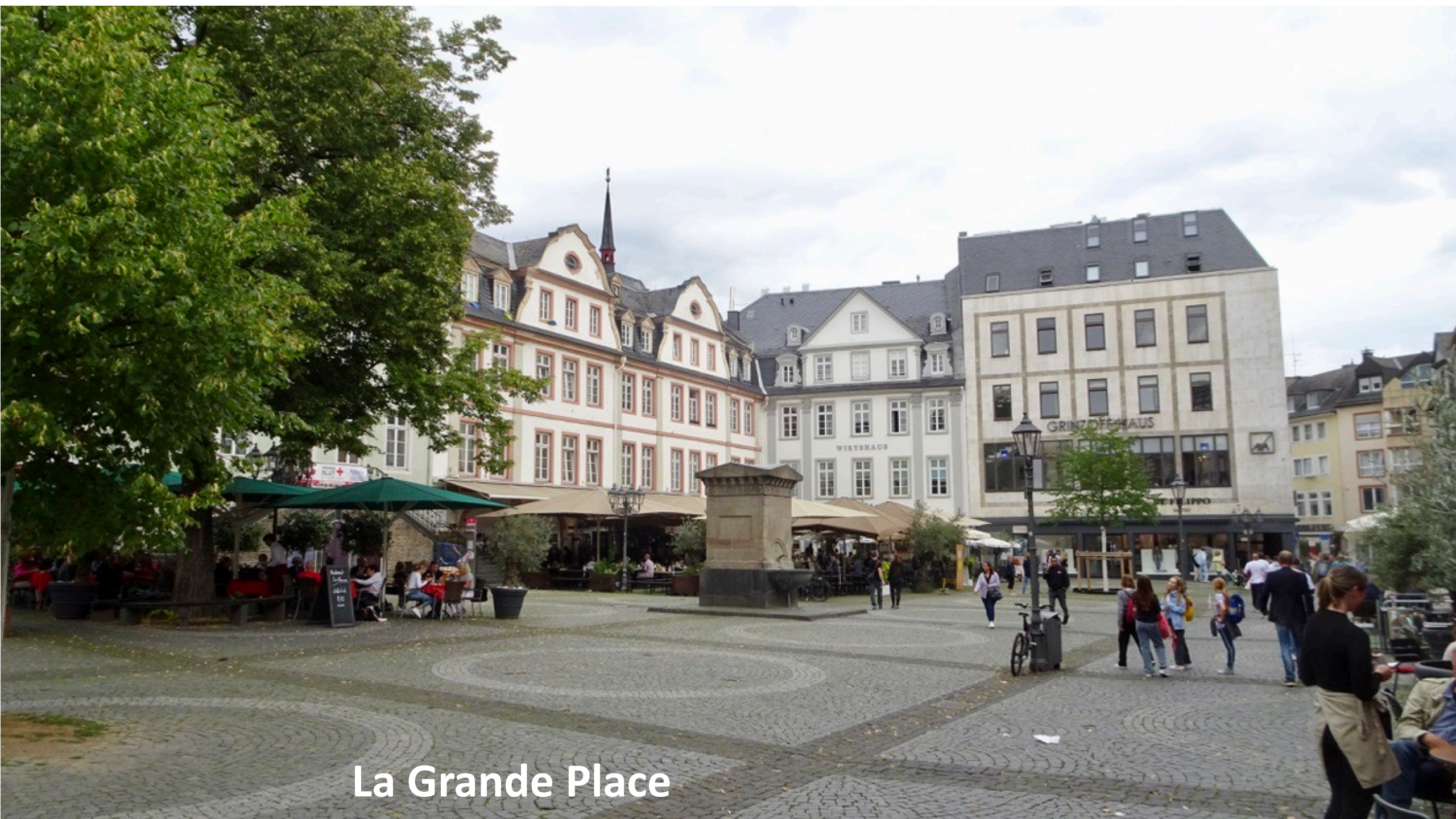
La Grande Place