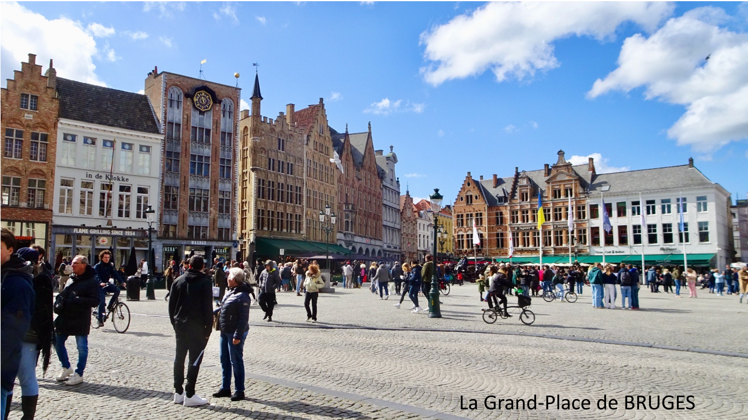
La Grand-Place de BRUGES