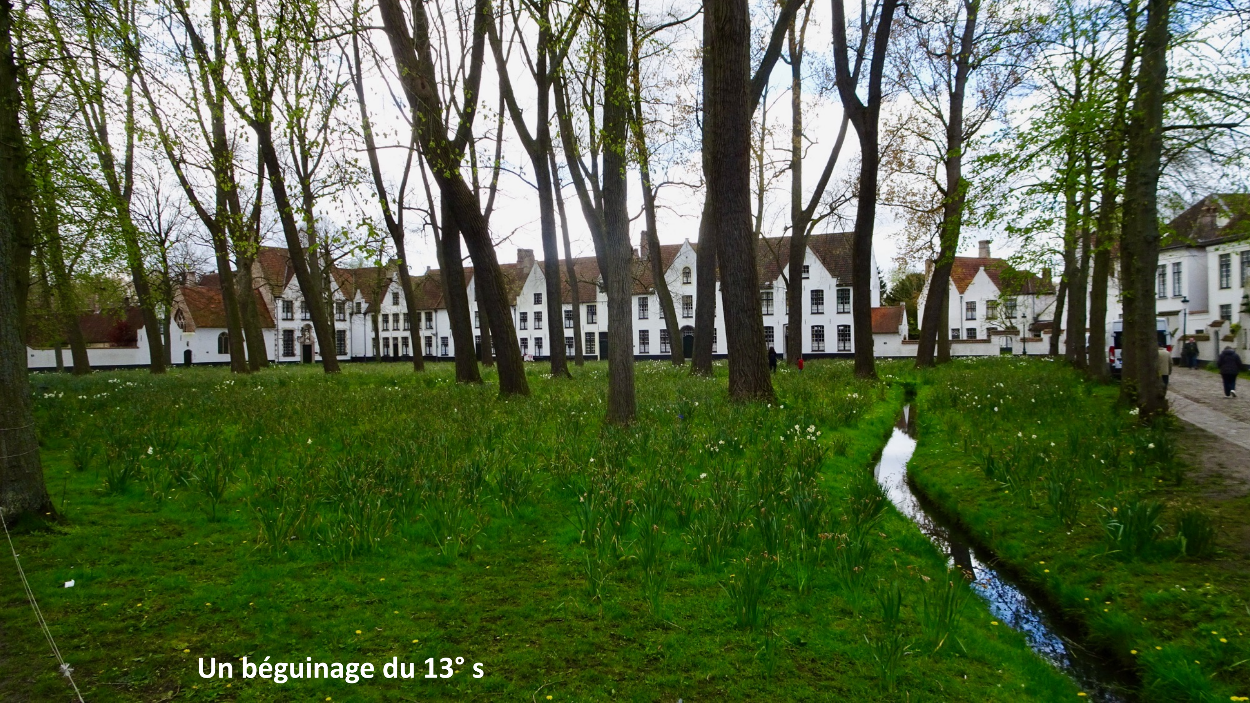
Un béguinage du 13 e s