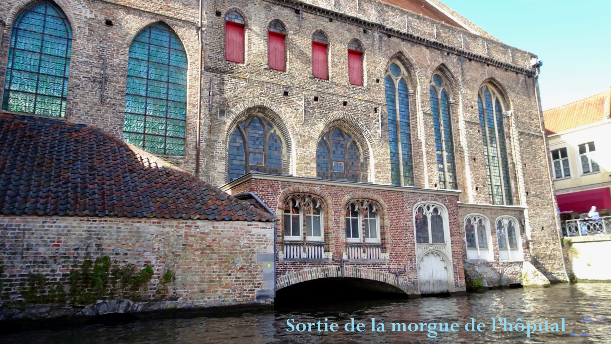
Sortie de la morgue de l'hôpital