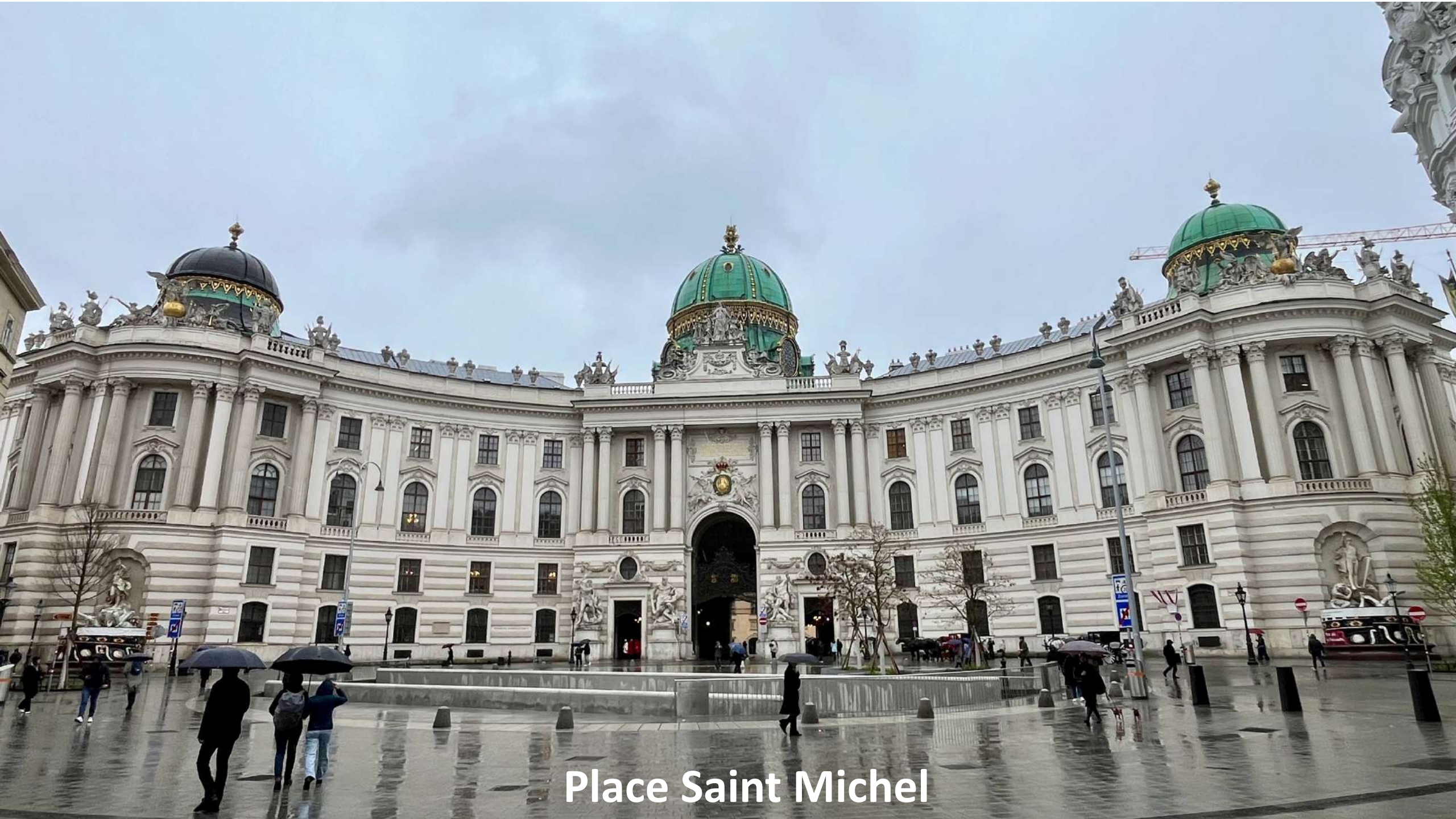
Place Saint Michel