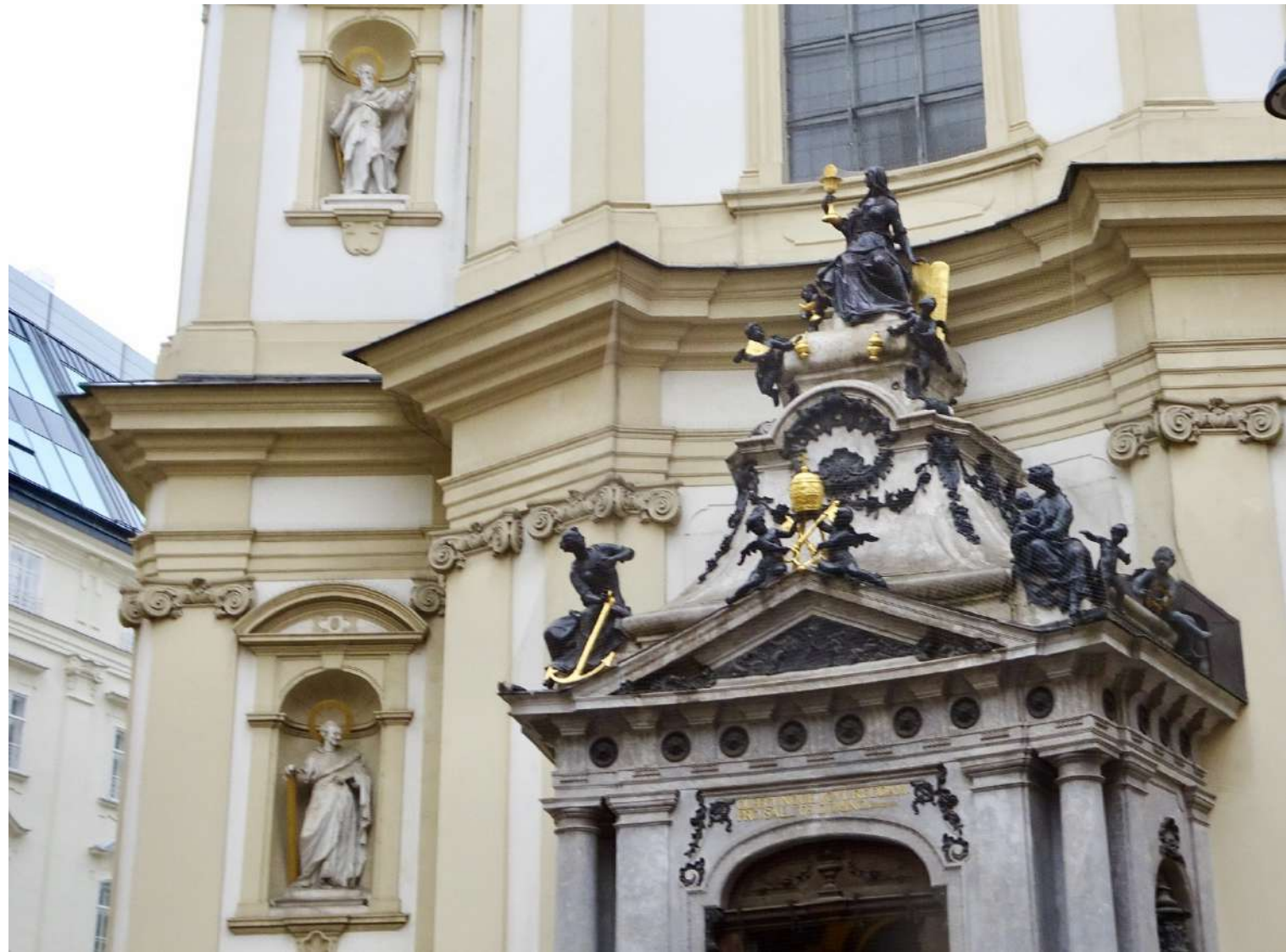
Église Saint PIERRE (1702)