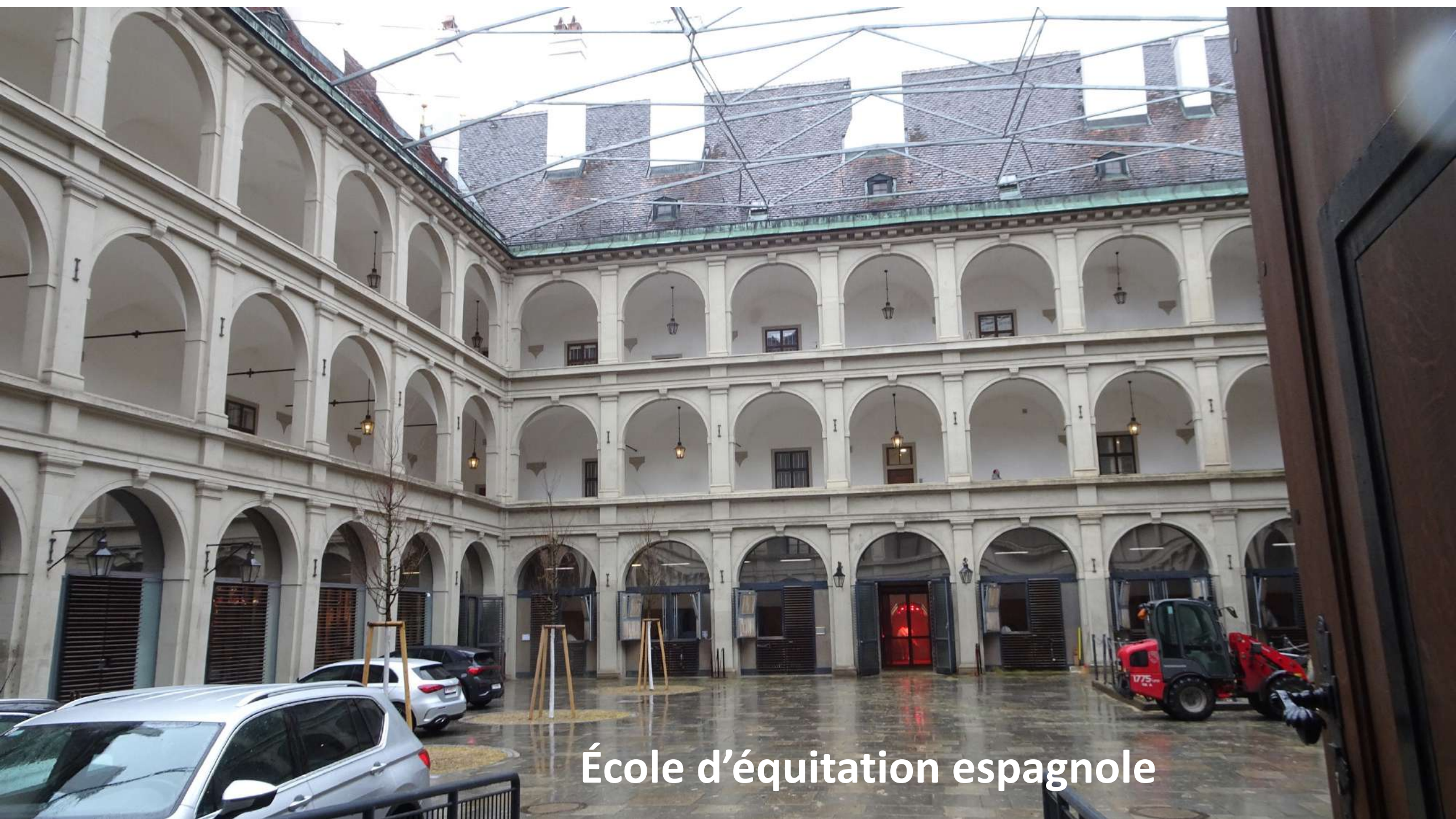
École d'équitation espagnole