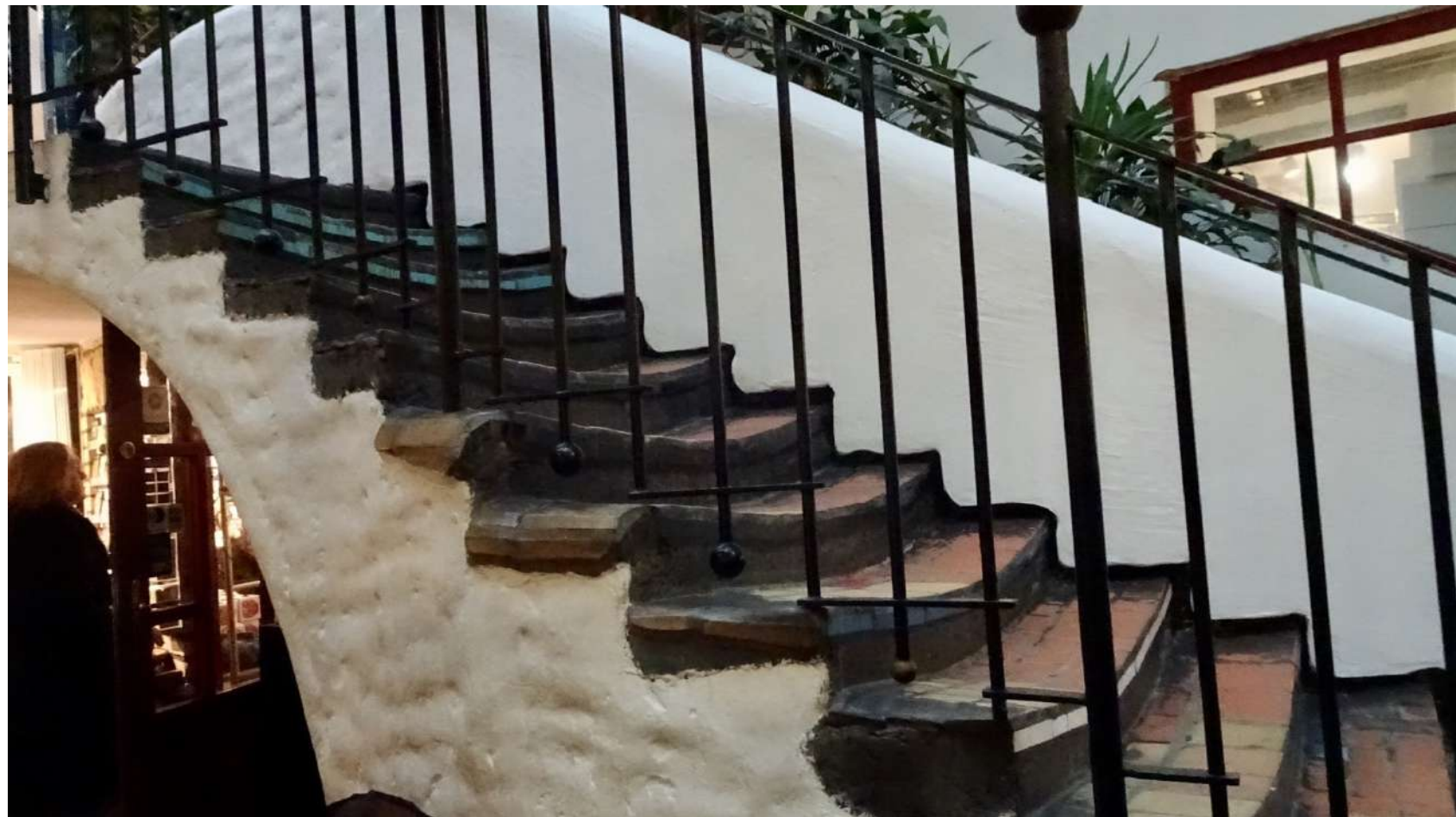
Escaliers courbés, (qui se montent sans problème)