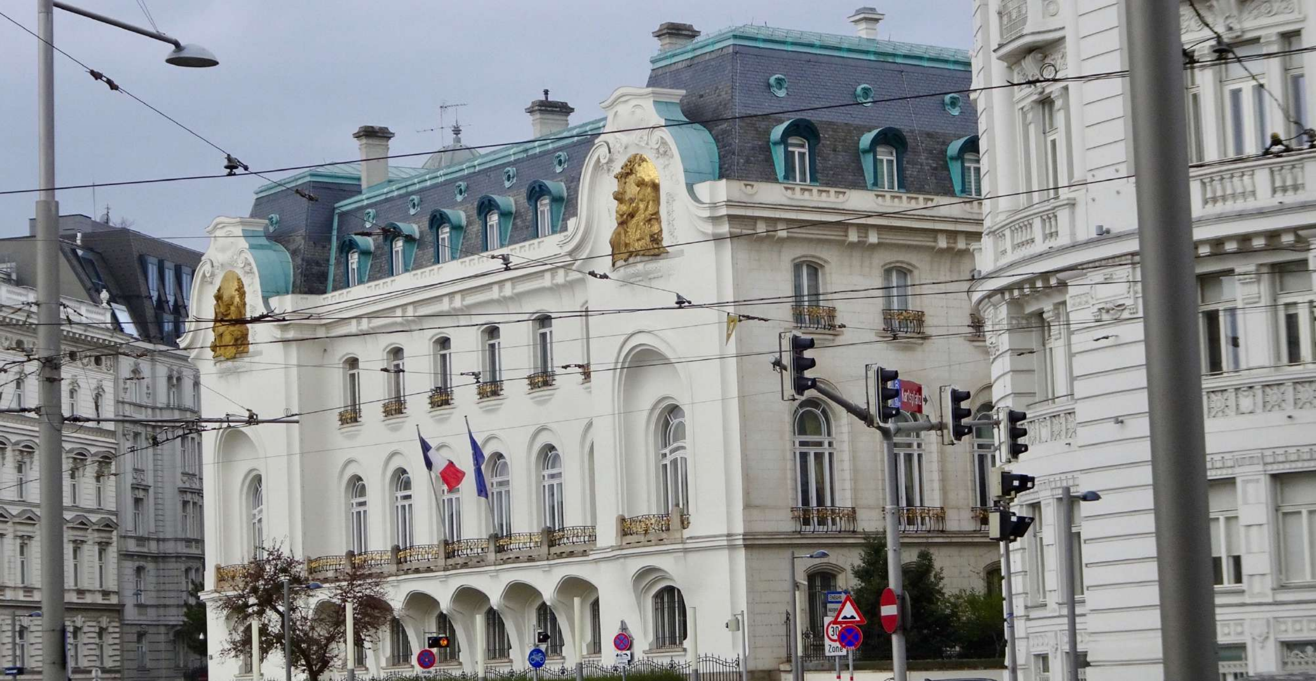
Ambassade de FRANCE à VIENNE