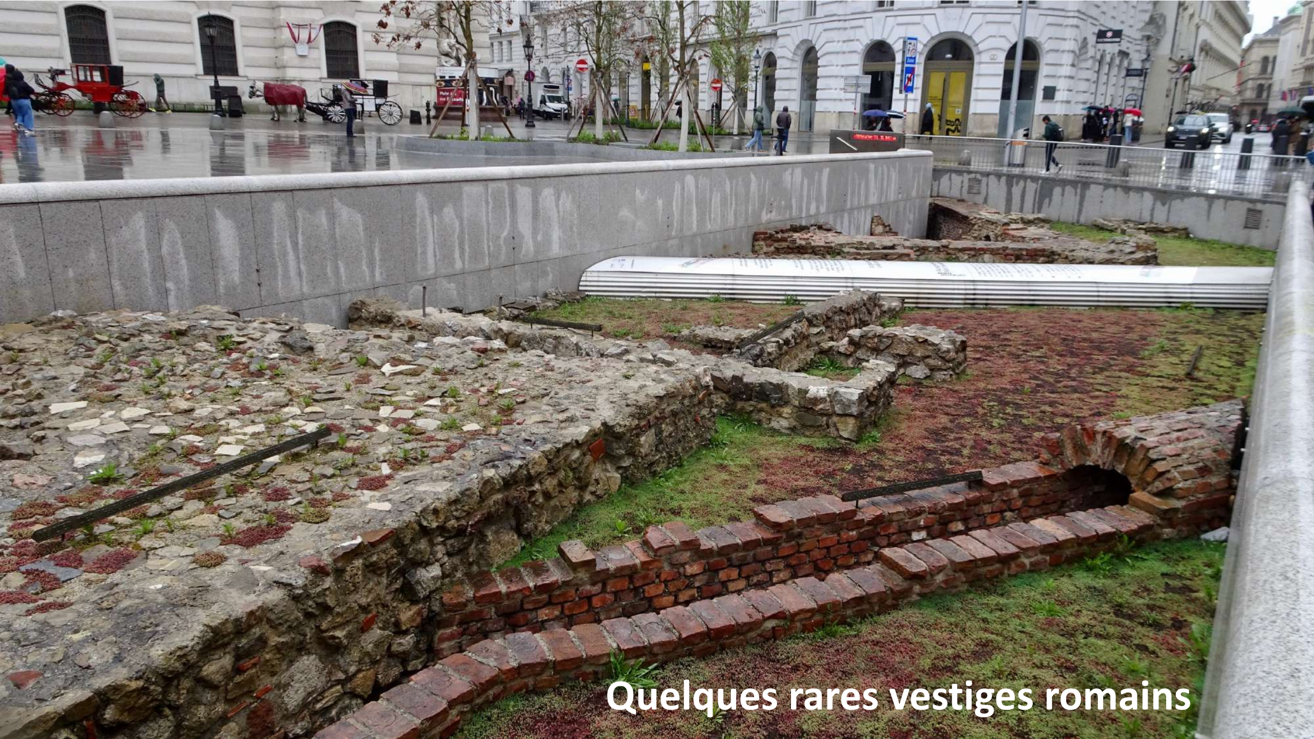
Quelques rares vestiges romains