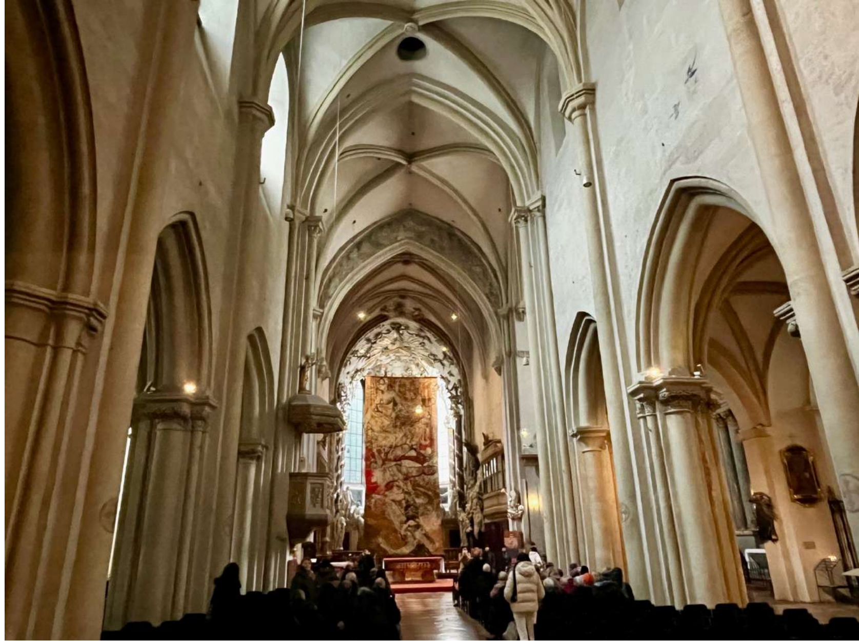
Église Saint Michel