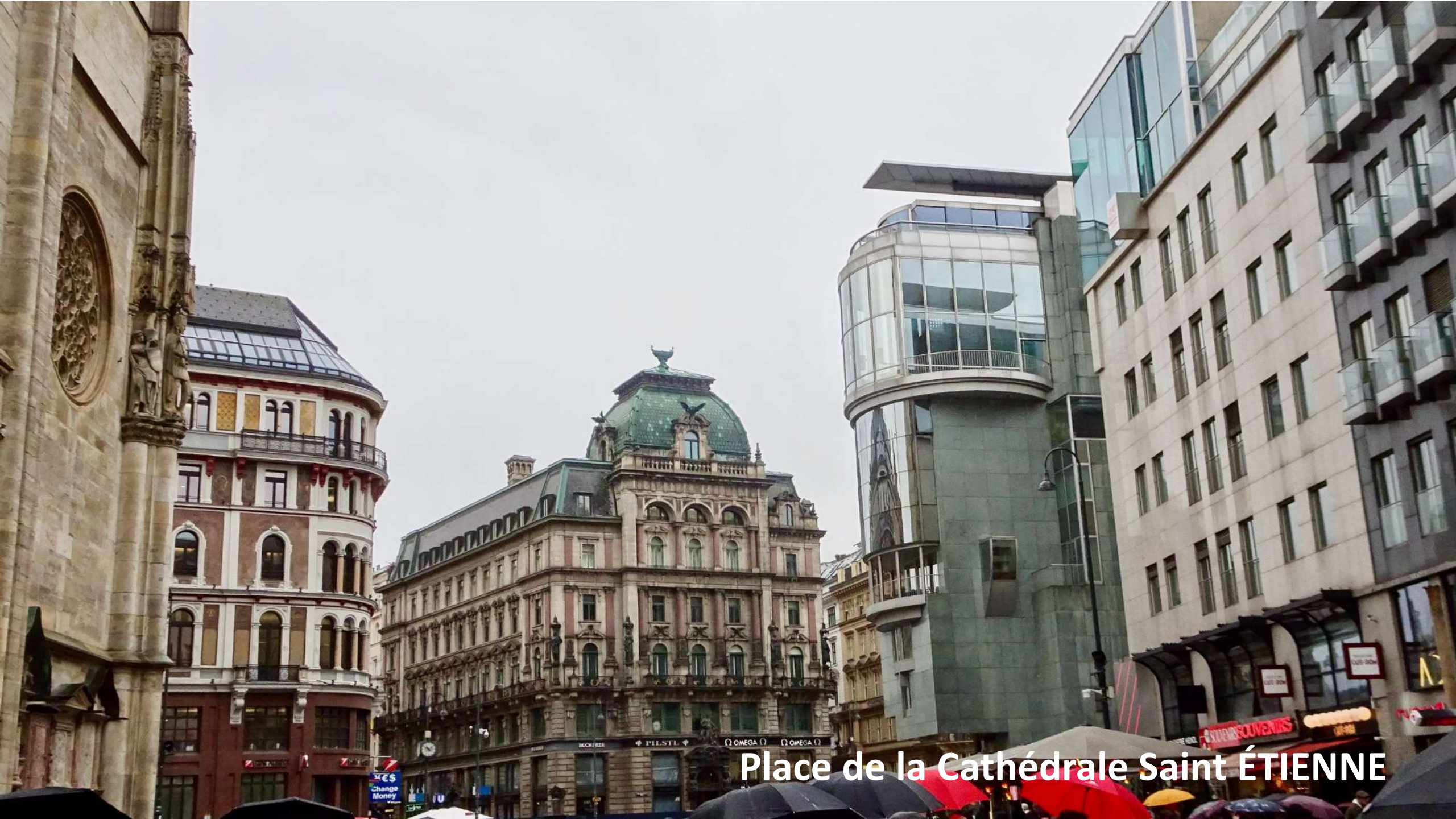
Place de la Cathédrale Saint Étienne