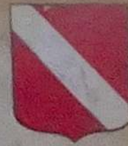
SIRES DE NEUFCHATEL XIV e XVI e