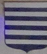
COMTES DE VAUDEMONT XI e XIV e

. SOYEZ LES BIENVENUS, VOUS ÊTES SUR LE SITE D'UN DES PLUS GRANDS CHÂTEAUX FORTS D'EUROPE. . WELCOME HERE, YOU ARE ON THE SITE OF ONE THE MOST IMPORTANT CASTLE IN ALL EUROPE. . WILLKOMMEN, SIE BEFINDEN SICH AUF DEM GELÄNDE EINER DER BEDEUTENDSTEN BURGEN EUROPAS. . WELKOM, JULLIE BEVINDEN ZICH OP DE LIGGING VAN EËN DER BELANGRÏKSTE KASTELEN IN EUROPA.