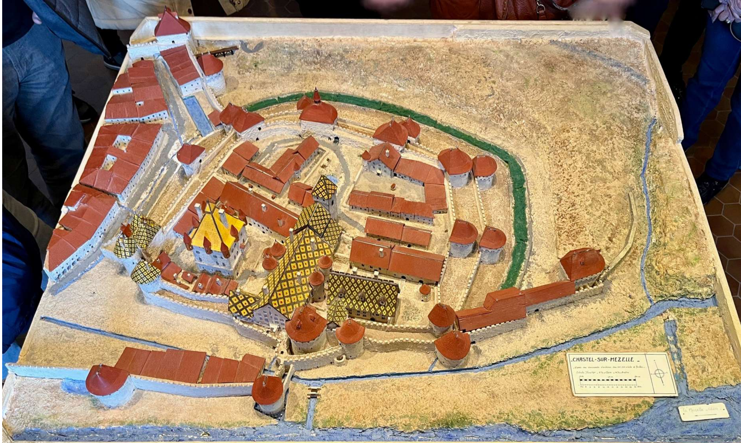
.CHASTEL-SUR-MEZELLE . Après une seconde destruction au XVI e siècle et brûlé. Eglise: 15 e siècle - 15 e siècle - 15 e siècle 100m