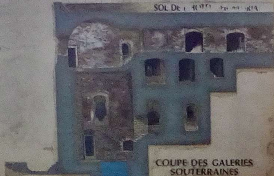
COUPE DES GALERIES SOUTERRAINES