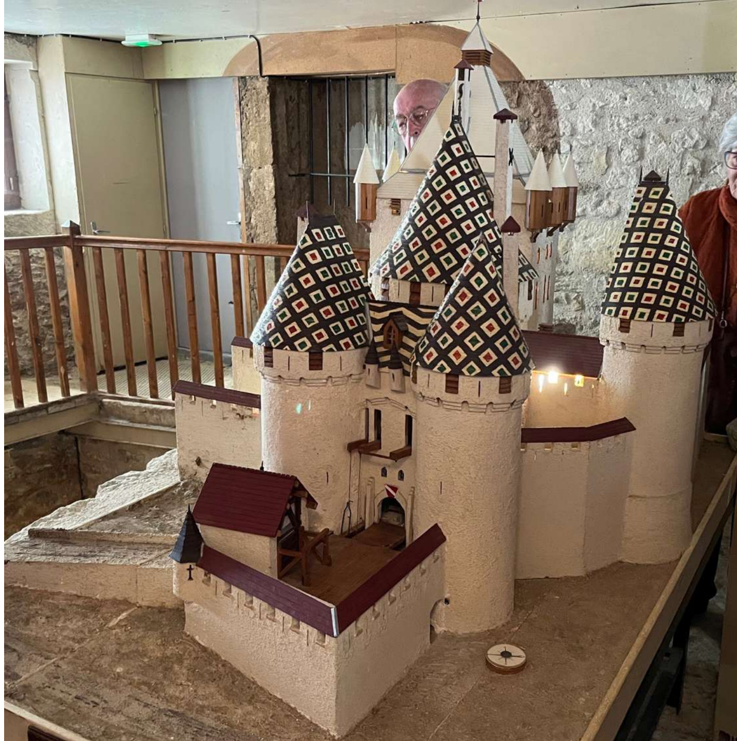
Maquette de l'entrée principale avec double pont-levis