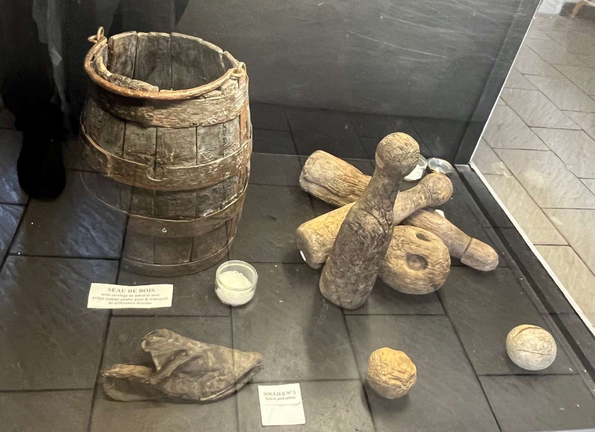
SEAU DE BOIS avec cerclage de métal et une utilisé comme panier pour le transport de différentes denrées